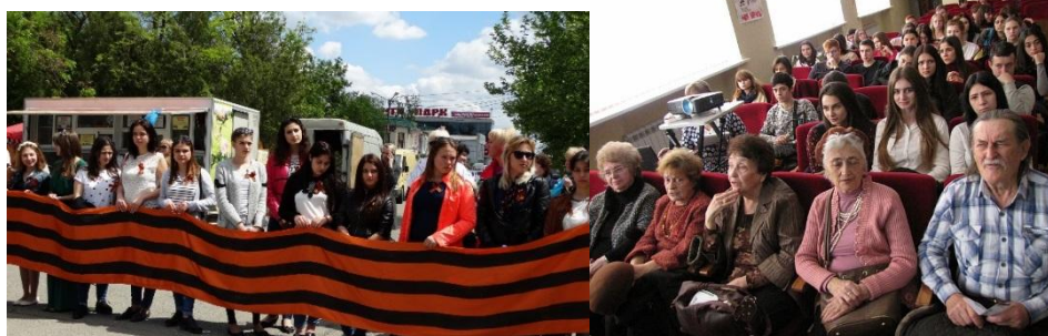
Фото отчет мероприятий